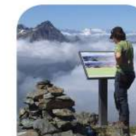
Uno dei pannelli panoramici (ph. Chiara Leonoris)

Pann. 3a - Aspetti geologici e strutturali della Falda del Monte Rosa, unità di origine europea. Litotipi della Zona Sesia-Lanzo, unità di origine africana. Pann. 3b - I suoli ad alta quota e le caratteristiche dei suoli di Cimalegna. Pann. 4a - Aspetti litologici e strutturali delle unità oceaniche della Zona Piemontese dei Calcescisti con Pietre Verdi: geologia dell'Unità del Combin al Col d'Olen e dell'Unità di Zermatt-Saas sul Corno del Camoscio. Pann. 4b - I fattori di formazione del suolo a Cimalegna e la vegetazione.