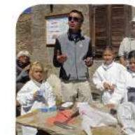
Attività didattica pedologica

Pann. 1a - Descrizione del percorso e inquadramento geologico-strutturale. Pann. 1b - Geologia dell'altopiano di Cimalegna: carta e profilo.