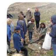
Attività didattica geologica

Pann. 2a - Dall'oceano mesozoico della Tetide alla catena collisionale alpina. Sezioni litosferiche e geodinamica delle Alpi nord-occidentali dal Giurassico all'Eocene. Pann. 2b - Pedologia: il suolo e i cinque fattori di formazione.